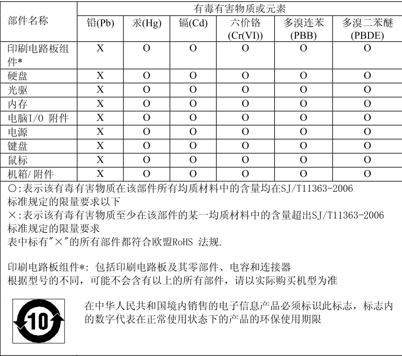
产品中有毒有害物质或元素的名称及含量

下表中的信息适用于在 2007 年 3 月 1 日及以后生产并在中华人民共和国销售的产品。